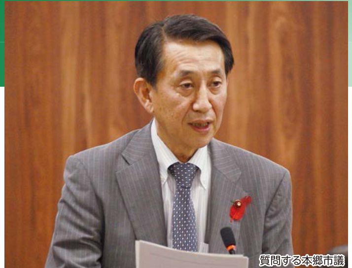
質問する本郷市議

不特定多数の人が利用するホテル・旅館等の商業施設の耐震化を進める為に、耐震診断・耐震改修に係る経済的な負担軽減策や利用しやすい補助制度の支援策の充実を求めた。